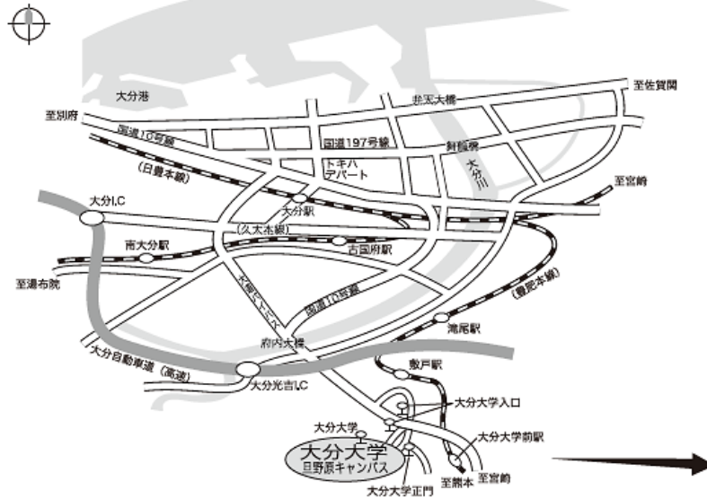
大分大学巨野原キャンパス位置図